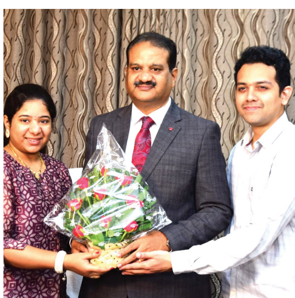
కుటుంబ సభ్యుల అభినందనలు