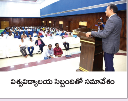
విశ్వవిద్యాలయ సిబ్బందితో సమావేశం