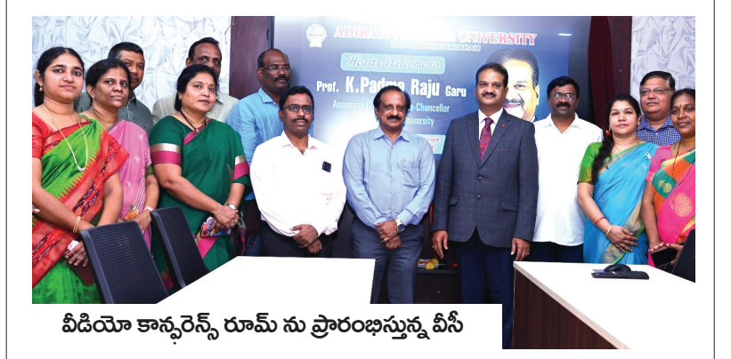
వీడియో కాన్ఫరెన్స్ రూమ్ ను ప్రారంభిస్తున్న వీసీ