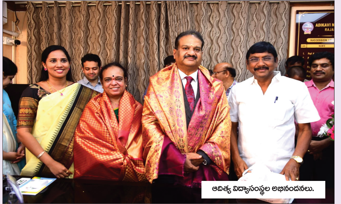
ఆదిత్య విద్యాసంస్థల అభినందనలు.